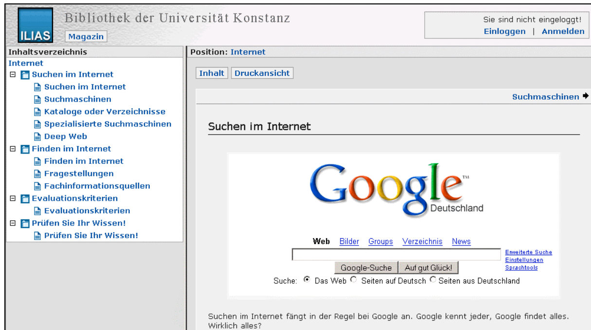
Abbildung 1: Modul „Internet“ der UB Konstanz

Der Modulaustausch wurde mit dem Ziel durchgeführt, E-Learning-Materialien aus Konstanz in der Mannheimer Lernumgebung und E-Learning-Tutorials aus Mannheim in der Konstanzer Lernumgebung anzubieten. In beiden Fällen ergeben sich trotz Standard-Konformität Kompatibilitätsprobleme verschiedener Art. So treten z. B. beim Import eines durch den RELOAD Editor erzeugten SCORM-Pakets 9 in die Konstanzer Plattform Performance-Probleme auf, die beim Austausch von Modulen zwischen ILIAS-Anwendern unbekannt sind. 10