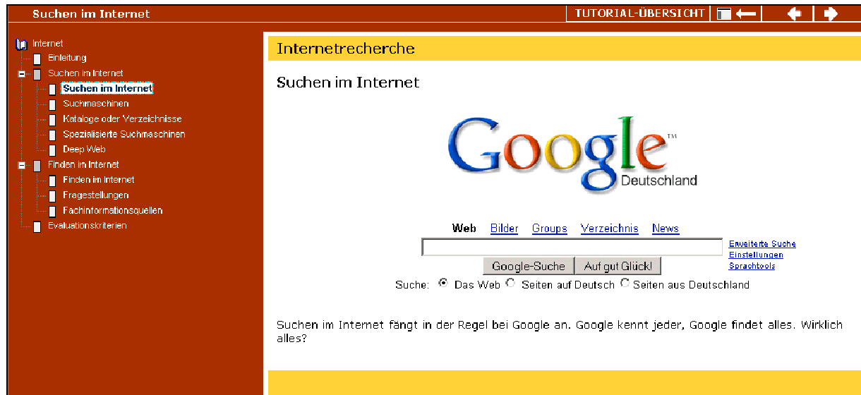
Abbildung 4: Konstanzer Modul "Internet" im Mannheimer Layout

geringfügiger redaktioneller Änderungen. Unterschiede im (medien)didaktischen Konzept bleiben bei dieser Art der Anpassung allerdings weiterhin bestehen.