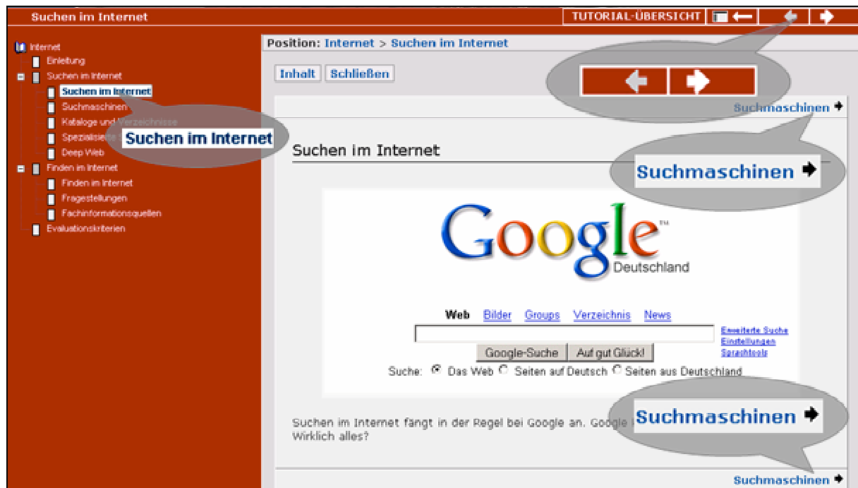
Abbildung 3: Überprüfung der Navigationsführung und Usability

Seiten verlieren außerhalb des ILIAS-Rahmens ihre Bedeutung. Die in ILIAS kohärente Navigation innerhalb der einzelnen Modulseiten fügt sich nur schlecht in die Benutzerführung der durch die RELOAD Software erzeugten Modulpakete ein: Durch die Betätigung des Vor- und Zurück-Buttons wird hier in der Inhaltsübersicht automatisch die Seite optisch hervorgehoben, auf der sich der Nutzer gerade befindet (vgl. Abbildung 3). Navigiert man innerhalb der Modulseiten, wie es das ILIAS-Design vorgibt ist, greift diese Funktionalität nicht.